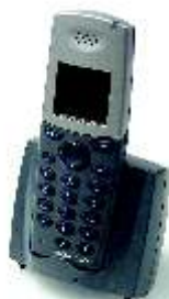
DECT Phone D300

Das SwyxPhone S315 ist die kostengünstige Einstiegsvariante, um alle Vorteile der SIP-Telefonie zu nutzen. Das SwyxPhone S315 verbindet klassisches Design und modernste Technik mit einem ausgezeichneten Preis-/Leistungsverhältnis. Über den SwyxIt! Telefonie-Client wird die bequeme Steuerung eines SwyxPhone S315 möglich, z.B. das Wählen aus Telefonbüchern, Anruflisten, aus Microsoft® Outlook oder anderen Anwendungen. Die Inbetriebnahme und Wartung des SwyxPhone S315 gestaltet sich einfach: Ein Installationsassistent ermöglicht eine schnelle Inbetriebnahme des Telefons. Weitergehende Konfigurationen lassen sich bequem über das Web-Interface vornehmen.