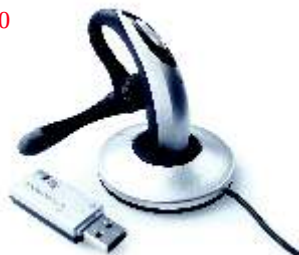
SwyxIt! Headset H390

Mit der schnurlosen DECT-over-IP Lösung von SwyxWare sind Mitarbeiter im gesamten Firmengelände erreichbar. Benutzer eines IP-DECT Telefons von Swyx sind voll integriert in SwyxWare, einschließlich Signalisierung ihres Status an andere Nutzer. Die DECT-over-IP Lösungen sind somit ideal für Mitarbeiter, die sich in weitläufigen Lager- oder Produktionshallen aufhalten.